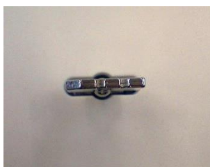
Nøkkel i låst posisjon